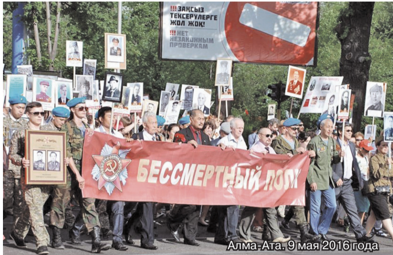
Алма-Ата. 9 мая 2016 года

святом для каждого ленинградца-петербуржца месте, на Пискаревском кладбище, 15 лет назад была открыта Аллея памяти.