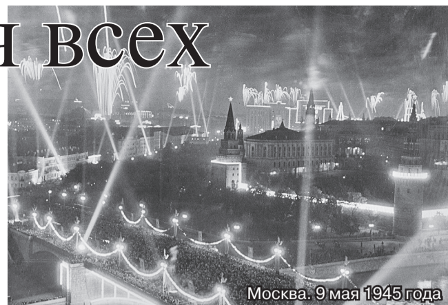
Москва. 9 мая 1945 года